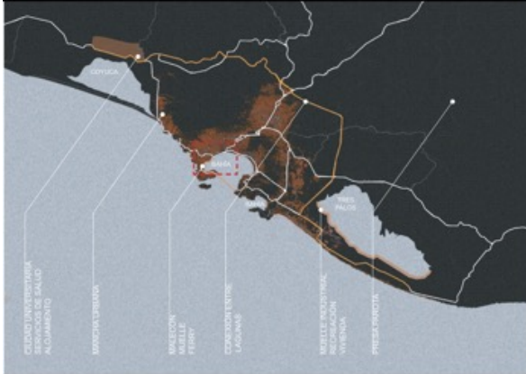
- VISIÓN MACRO -

EQUILIBRIO ECOLÓGICO / ESTRUCTURA URBANA / SISTEMAS DE MOVILIDAD / VEGETACIÓN Y PAISAJE URBANO / ESPACIO PÚBLICO Y RECREACIÓN / URBANISMO RESILIENTE