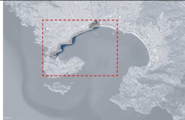
- BAHÍA DE ACAPULCO -

- RESCATE DE BAHÍAS ACAPULCO Y PUERTO MARQUÉS + INTERCONEXIÓN COYUCA Y TRES PALOS + DESAHOGO DE DENSIFICACIÓN + MODELOS ECONÓMICOS RESILIENTES + INFRAESTRUCTURA + CONSERVACIÓN AMBIENTAL + EDUCACIÓN Y TURISMO + SERVICIOS MÉDICOS + PARTICIPACIÓN COMUNITARIA -