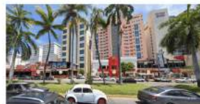
Vista Hoteles Ritz, Bnow y Torre Palado