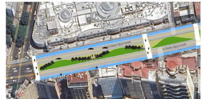
Esquema base rediseño de camellón como espacio público

El malecón o Avenida Costera, es una vialidad principal de Acapulco cuyo uso actual es predominantemente vehicular. En esta propuesta se pretende la creación de ciclovías así como el aprovechamiento del camellón como espacio público.