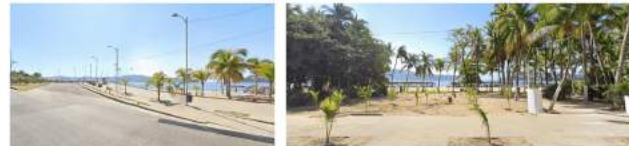
Vista a la zona de playa (Playa Tamarindos)

La liberación de la zona de playa permite disminuir los riesgos ante fenómenos naturales al contar con una mayor superficie de amortiguamiento en donde la vegetación juega un papel fundamental. Por otro lado, la vista a la playa/mar resulta de vital importancia en las ciudades costeras con vocación turística, sin embargo, en el caso de Acapulco, esta vista se ha restringido.