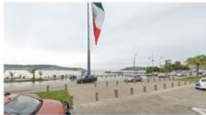
Vista a la zona de playa (Asta bandera)

A medida que se recorre la Avenida Costera de oeste a este, es notoria la privatización de la vista y el acceso a la zona de playa por medio de complejos hoteleros cuyas edificaciones se encuentran fuera de escala lo cual representa un riesgo importante al cimentarse en suelo suave y, además, no cumplen con las especificaciones propias del sitio en el cual se encuentran (anticiclones, antisismo, etc.).