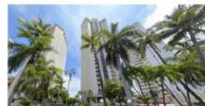
Vista Hotel Los Torres Gemelos de Acapulco

En la zona poniente de la Avenida Costera se encuentran múltiples edificaciones de gran altura, algunas de ellas se encuentran tan juntas que parecen ser un mismo bloque, privatizando los accesos directos a la playa.