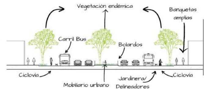
Propuesta base rediseño de Avenida Costera

Se propone que el diseño surja de un proceso participativo de la población empleando materiales con baja huella de carbono; asimismo, se opta por vegetación endémica que, en el caso del camellón se oriente al sur para generar sombra y poder aprovechar el camellón como espacio público en donde las dimensiones lo permitan dotándolo de mobiliario urbano básico.