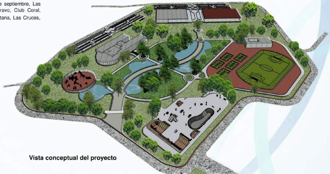
Vista conceptual del proyecto