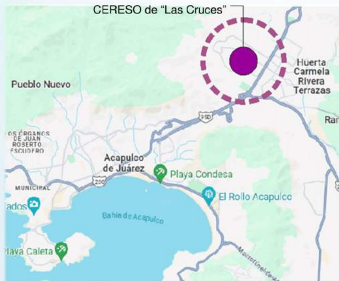
Localización del área de influencia

Al interior se genera, corrupción, violencia, tráfico de drogas y operan asociaciones delictivas, es esto lo que genera graves condiciones de inseguridad en la zona que lo rodea, además de ser obsoleto y estar en muy malas condiciones de mantenimiento no cumple con los conceptos de reinserción social que establece la ley.